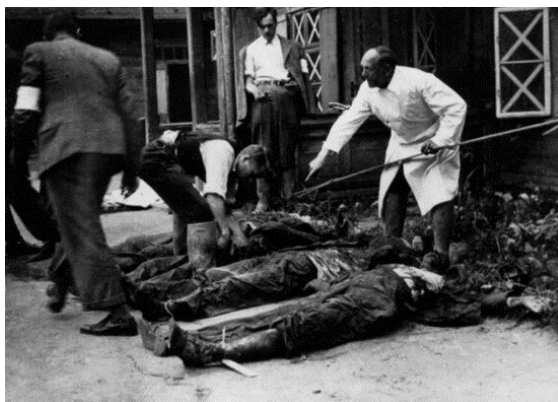
369 Opfer des sowjetischen NKWD in Tartu, Estland, 1941

verbrannt, um jeden Hinweis auf Nationalismus und Christentum zu beseitigen, nur Marx, Lenin und Trotzki waren erlaubt. 1940 hassten wir Hitler und Deutschland, wir fühlten uns verraten, als Hitler von der Rettung Europas sprach, dann aber mit den Sowjets zusammenarbeitete, um unsere Besetzung zu ermöglichen.