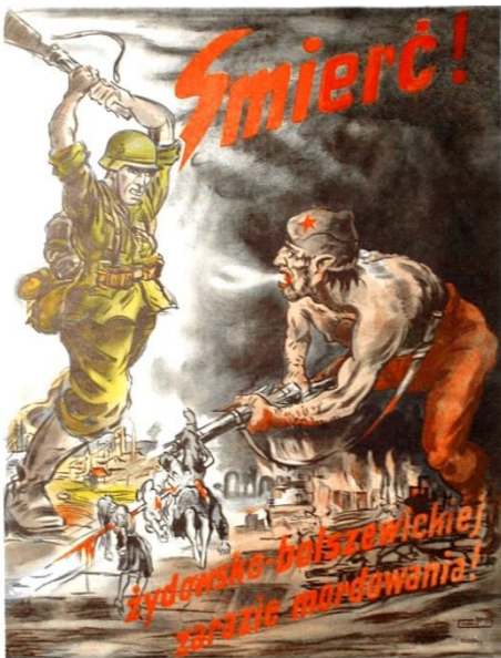
Propaganda-Plakat während der NS-Besetzung Polens. Auf dem Plakat steht: „Tod! der jüdisch-bolschewistischen Mordpestilenz!“

Nicht alle Juden wurden verfolgt. Es gab einige in Estland, die loyal waren und in Frieden lebten und diejenigen, die sich entschieden, unseren Feinden zu helfen oder unser Volk anzugreifen, wurden sehr hart angefasst. Es war nicht ungewöhnlich, von Angriffen auf Juden durch die Verwandten derer zu hören, denen sie geholfen hatten, sie zu vertreiben. Die Deutschen mussten sogar gegen einige Milizen vorgehen, die sich an manchmal unschuldigen Juden rächten.